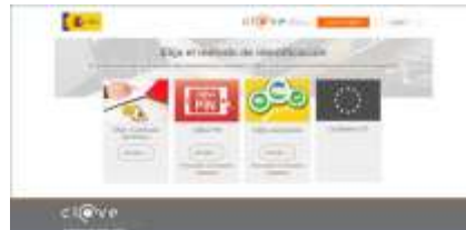
Figura 1– Acceso mediante el método de identificación DNIe/Certificado electrónico a través de Cl@ve.

Para acceder al formulario es necesario disponer de un Certificado Digital de Persona Física o de Persona Física con Representación de Persona Jurídica. El acceso también se puede realizar mediante el método de identificación DNIe/Certificado electrónico a través de Cl@ve.