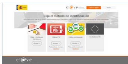
Figura 1– Acceso mediante el método de identificación DNIe/Certificado electrónico a través de Cl@ve.